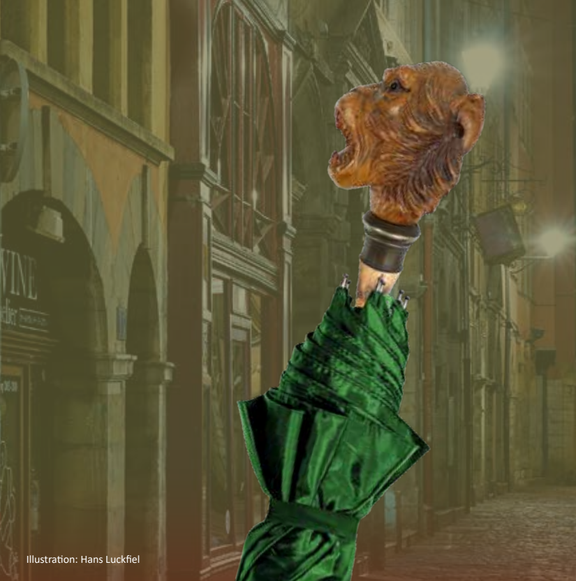
Illustration: Hans Luckfiel